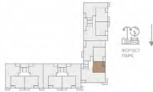
ПОЭТАЖНЫЙ ПЛАН ЭТАЖ 2-10

ПЛОЩАДЬ КВАРТИРЫ.....41.57 м 2 - 41.72 м 2 ПЛОЩАДЬ БАЛКОНОВ... 2.96(2.07 м 2 ) - 4.51(1.35 м 2 ) ОБЩАЯ ПЛОЩАДЬ.....42.92 м 2 - 43.79 м 2