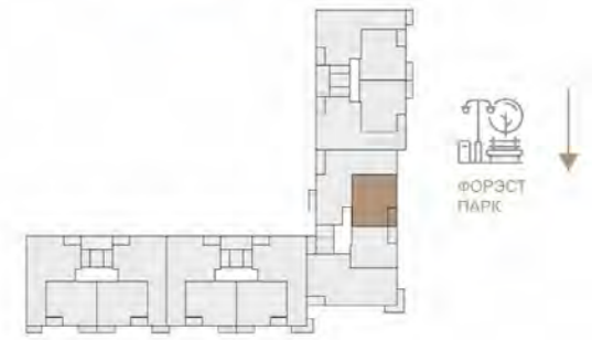
ПОЭТАЖНЫЙ ПЛАН ЭТАЖ 1-10

ПЛОЩАДЬ КВАРТИРЫ.....48.09 м 2 - 48.95 м 2 ПЛОЩАДЬ БАЛКОНОВ... 2.96(2.07 м 2 ) - 4.51(1.35 м 2 ) ОБЩАЯ ПЛОЩАДЬ.....49.44 м 2 - 51.02 м 2